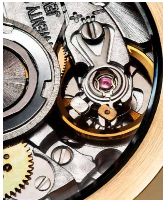
MODELL QUADRIGA 2021 18 KARAT | LIMITIERT AUF 75 STÜCK