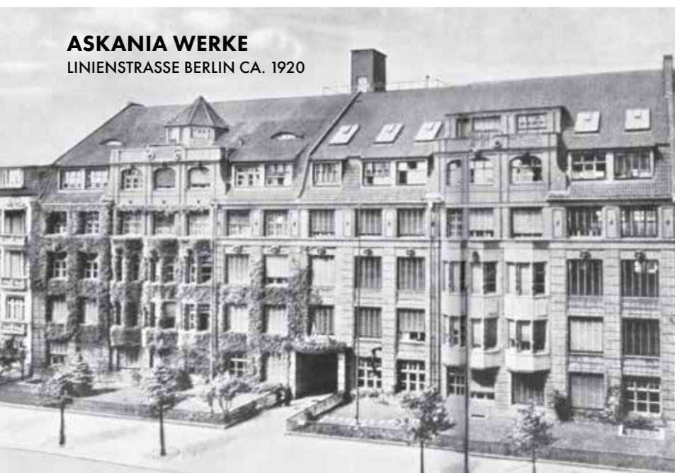
ASKANIA WERKE LINIENSTRASSE BERLIN CA. 1920