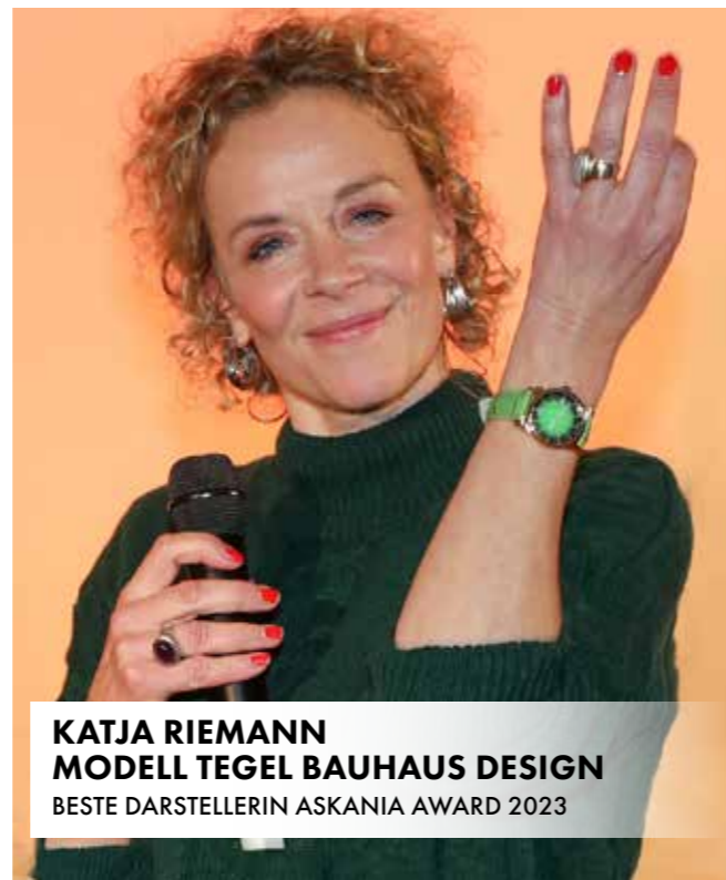
KATJA RIEMANN MODELL TEGEL BAUHAUS DESIGN BESTE DARSTELLERIN ASKANIA AWARD 2023