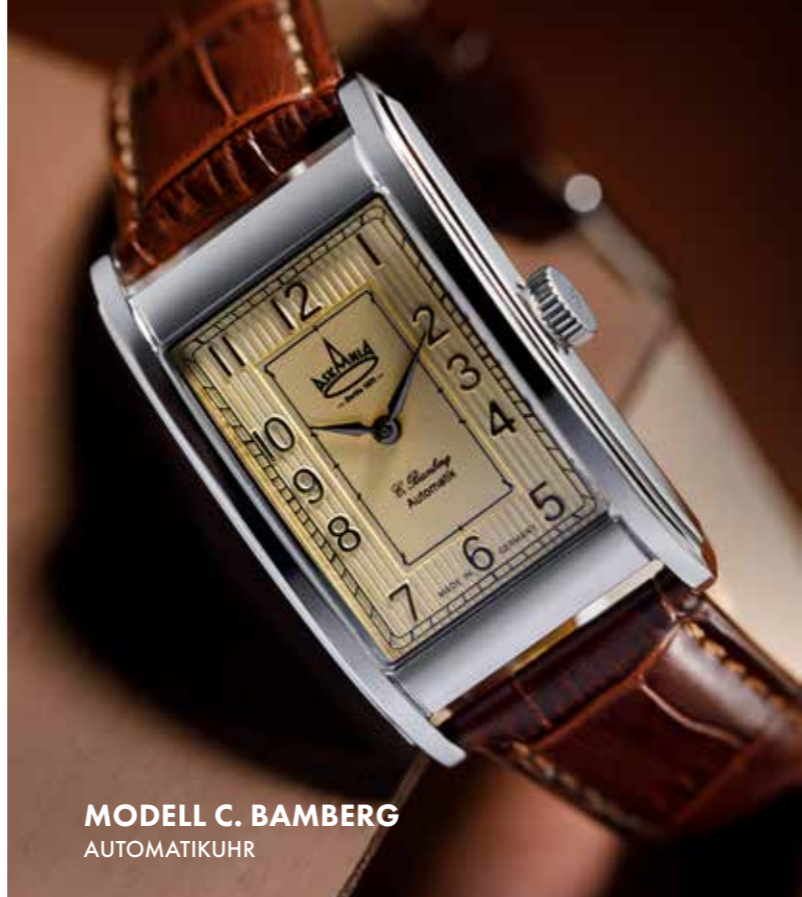
MODELL C. BAMBERG AUTOMATIKUHR