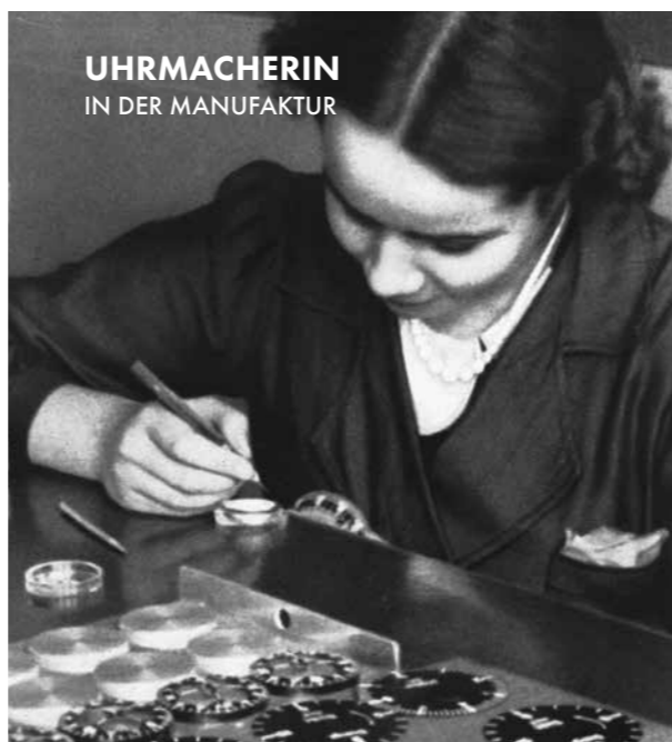
UHRMACHERIN IN DER MANUFAKTUR