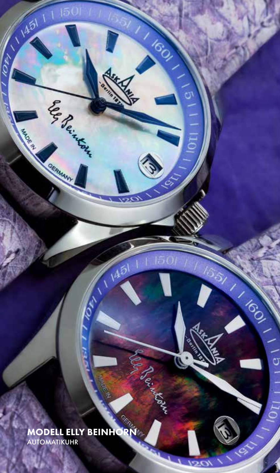
MODELL ELLY BEINHORN AUTOMATIKUHR