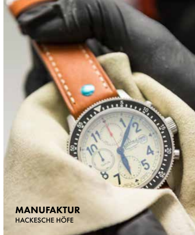
MANUFAKTUR HACKESCHE HÖFE